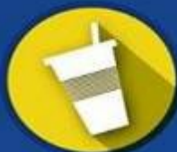
VASOS desechables plásticos