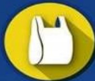
FUNDAS plásticas tipo camiseta