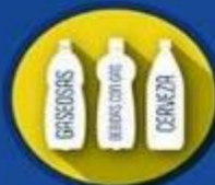
BOTELLAS no retornables Descartables de cerveza (Santa Cruz e Isabela)