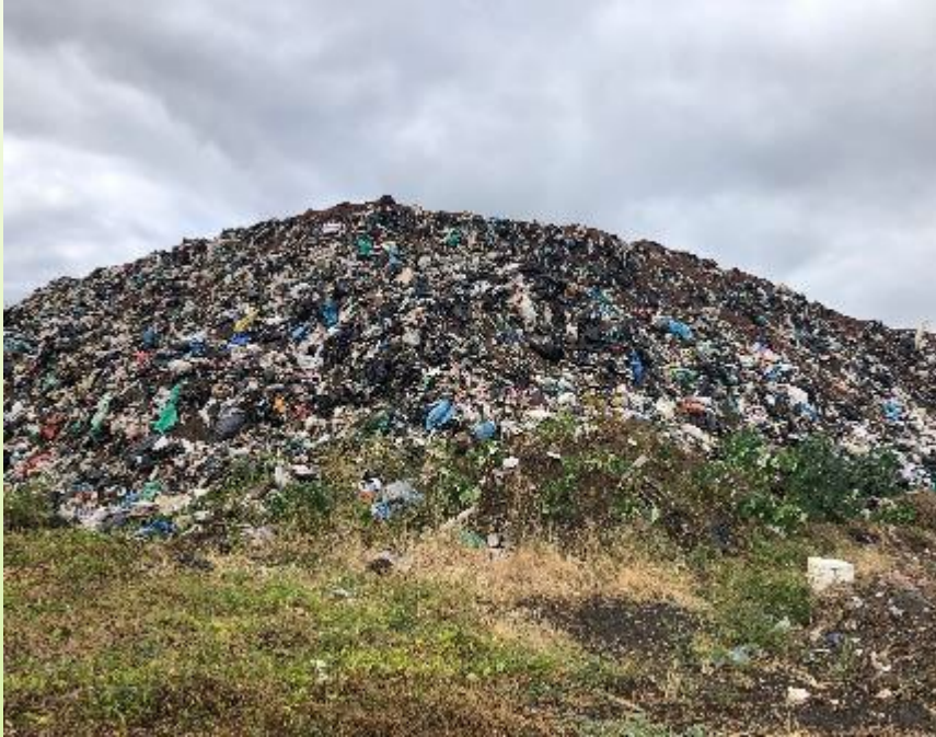
RELLENO SANITARIO FASE 1 OPERA DESDE SEPT. 2013 Y AL 2020 ESTÁ AL LÍMITE DE SU CAPACIDAD