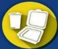
ESPUMAFLEX envases de poliestireno expandido

No ingresan a Galápagos los productos contaminantes derivados de los plásticos como: