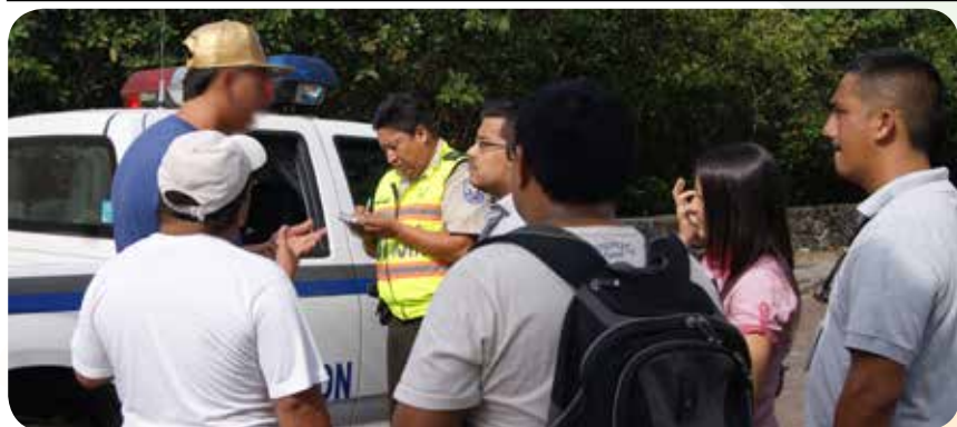
Controles migratorios que realiza el Consejo de Gobierno de Galápagos en coordinación interinstitucional