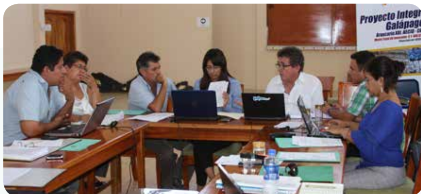
Última reunión de balance del 2013 en Isabela (Salón del Consejo de Gobierno)

bela. Hasta la fecha se han transferido al GADMI 494.000,00 dólares, de los cuales 370.000,00 es inversión del CGREG y los restantes 124.000,00 dólares son financiados por la Cooperación Española. El avance de la obra es del 70% y se prevé entregar al GADMI en el primer semestre del año 2014.