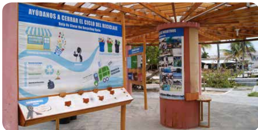
Maqueta de las obras que financia el Consejo de Gobierno en la Isla Isabela

En el marco del Proyecto Araucaria XXI-CGREG, se mantiene vigente un Convenio entre el Gobierno Autónomo Descentralizado de Isabela y el Consejo de Gobierno del Régimen Especial de Galápagos, con el fin de co-ejecutar la construcción del relleno sanitario y el centro de reciclaje en el cantón Isa-