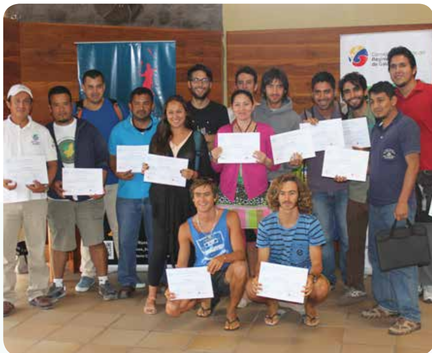
Finalización del taller Post Producción de Audio en San Cristóbal.

El arte y la cultura también recibieron el aporte del Gobierno Nacional a través del Consejo de Gobierno para la ejecución del Festival de Artes Plásticas y Escénicas BEAGLE, Talleres Permanentes de Danza en San Cristóbal y el Taller de sonido para Audiovisuales, Post Producción de Audio y Producción.