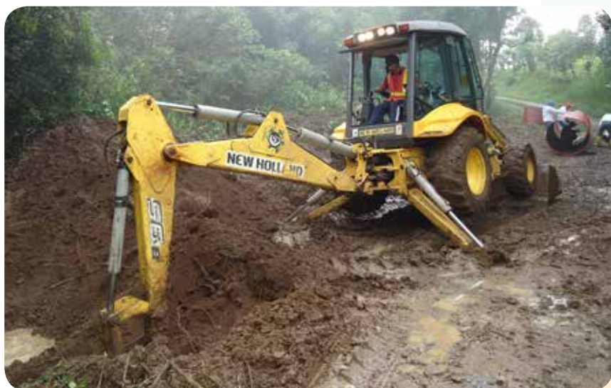
Instalación de alcantarilla en Bellavista-Media Luna. Isla Santa Cruz

Consejo de Gobierno de Galápagos realizó el diseño de acometida y panel de medidores, el rediseño de circuitos internos de distribución para el Centro de Desarrollo Humano, la impermeabilización de la loza de cubierta del bloque de dos plantas del colegio Miguel Ángel Cazares y la instalación de una alcantarilla en la vía Bellavista-Media Luna, en la Isla Santa Cruz. Se construyó además el tanque reservorio de agua para beneficio de 42 agricultores y ganaderos de los recintos Las Goteras y Cerro Verde, en San Cristóbal, y se capacitó a más de 70 caficultores en San Cristóbal, Santa Cruz, Floreana e Isabela.