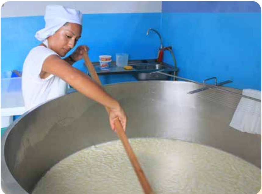
Elaboración de queso y yogurt en la Isla San Cristóbal

ductivos y fortalecer el conocimiento y la generación de empleo en las islas. Así mismo, el Consejo de Gobierno realizó la investigación y la publicación del estudio “Cumplimiento de Derechos y Deberes de Niñas, Niños y Adolescentes de Galápagos” que realiza un diagnóstico de la situación actual del ejercicio de derechos y deberes en el grupo de los más jóvenes de la provincia. Este estudio permitirá al Consejo de Gobierno de Régimen Especial de Galápagos priorizar programas y proyectos relativos a niñez y adolescencia.